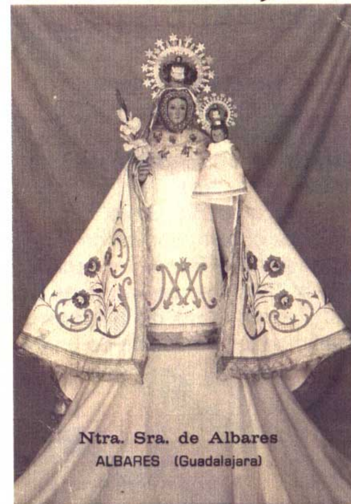
Ntra. Sra. de Albares ALBARES (Guadalajara)

SEMANA CULTURAL 2008 Del 30 de Julio al 3 de Agosto